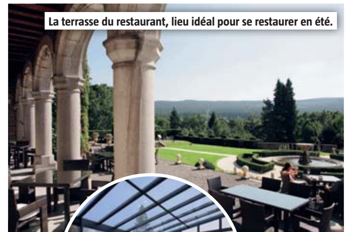
La terrasse du restaurant, lieu idéal pour se restaurer en été.