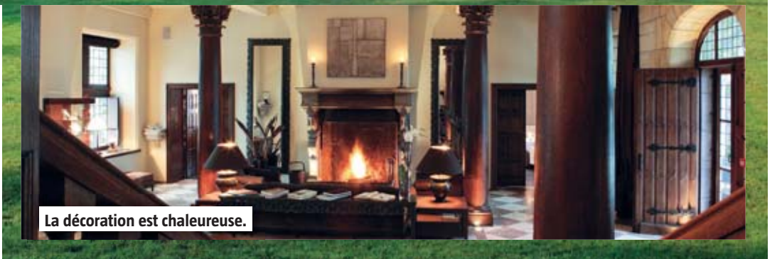
La décoration est chaleureuse.

Réminiscences de son glorieux passé, différents motifs architecturaux agrémentent le parc, que ce soient les armoiries de la famille Dresse de Lébioles restituées au fronton du monumental portail, une statue en pierre de Diane Chasseresse, un vaste étang aux nénuphars, un petit Pont des Soupirs ou encore, une maisonnette à colombages abritant la machine hydraulique qui sert à conduire les eaux du fond de