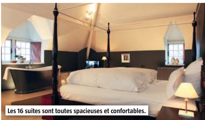
Les 16 suites sont toutes spacieuses et confortables.