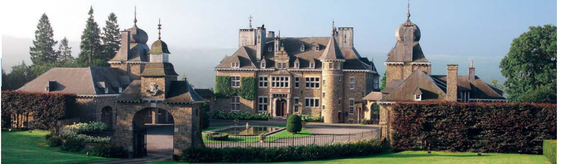
Rénové au début des années 2000, le site a retrouvé toute sa splendeur.

Dans un domaine magnifiquement arboré, le Manoir de Lébioles accueille ses hôtes