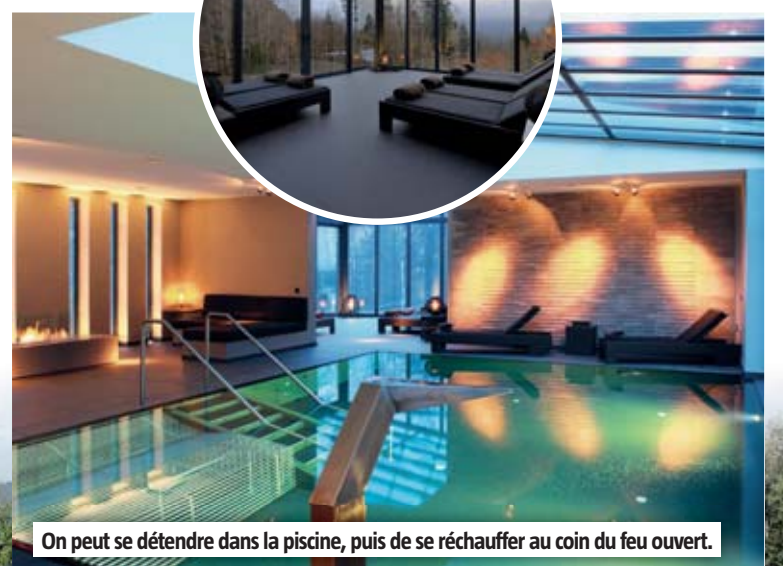
On peut se détendre dans la piscine, puis de se réchauffer au coin du feu ouvert.